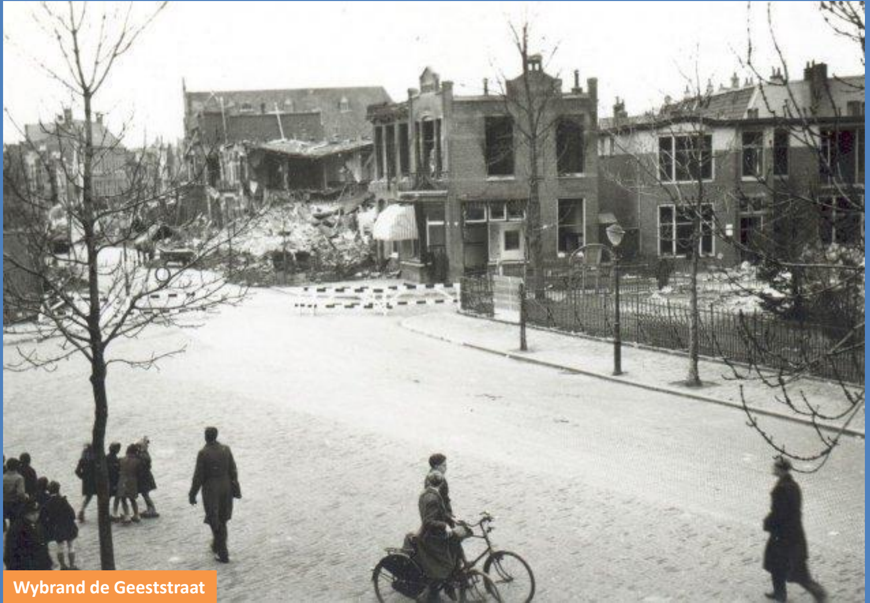
Wybrand de Geeststraat