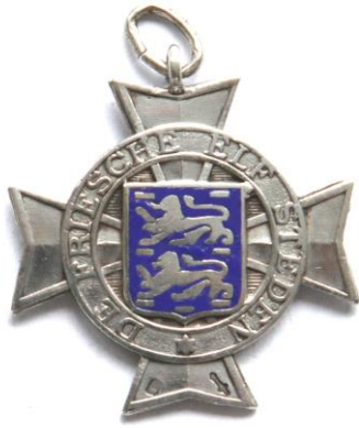
FIGUUR 2 ELFSTEDENTOCHTKRUISJE VIA SCHAATSHISTORIE