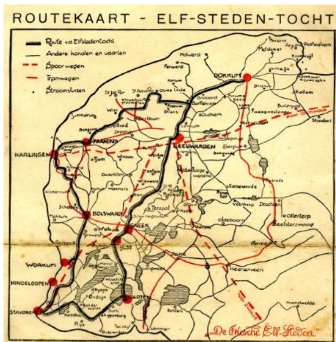
FIGUUR 1 AFBELDING MET ROUTE VAN DE ELFSTEDENTOCHT.