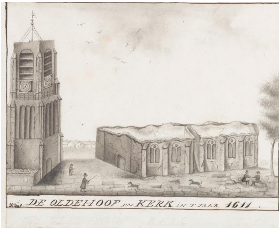
Bron 3. Gezicht op de Sint Vituskerk en de Oldehove in Leeuwarden, gezien vanaf het zuiden. Rechts staan de restanten van de kerk hoe deze er in 1611 bij stonden. De Oldehove staat op enige afstand links. Vervaardigd door H. Bos in 1611.