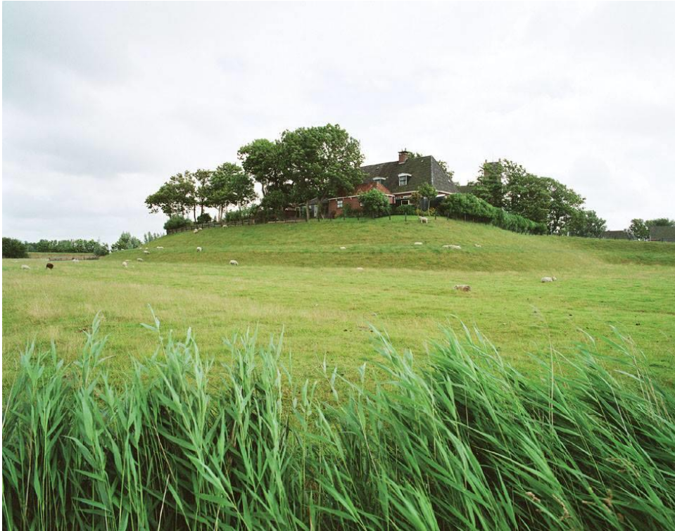
Bron 3. Een foto van een terp in Noord-Nederland, 2017.