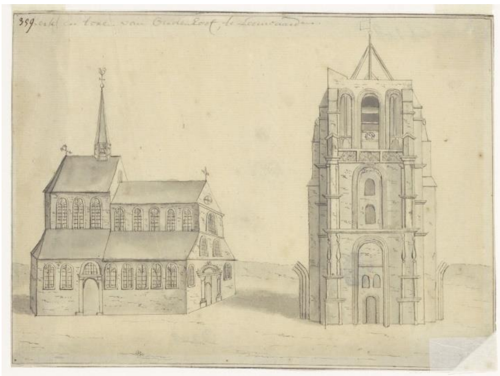
Bron 4. Gezicht op de Sint Vituskerk en de Oldehove in Leeuwarden, gezien vanaf het noordwesten. Links staat de kerk met hoger koor en de spitse toren en de Oldehove staat op enige afstand rechts. Vervaardigd door J. Stellingwerf in 1550.